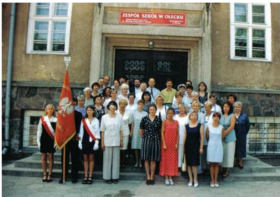
Fot. 15 Pracownicy Zespołu Szkół w Olecku.