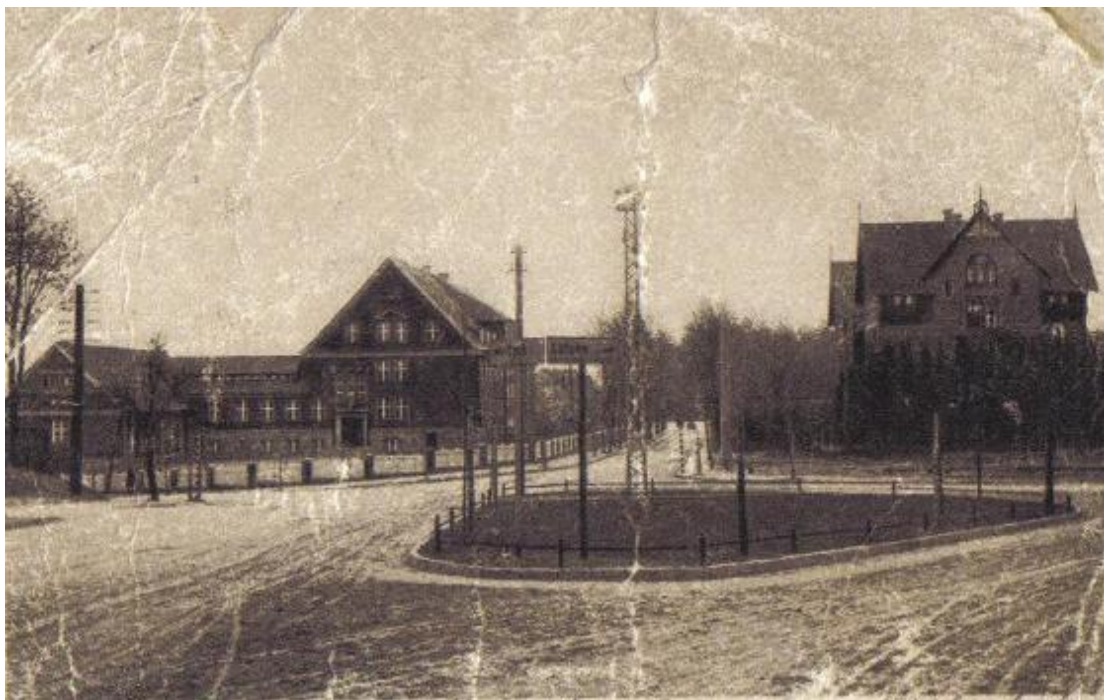
Fot 2. Szkoła Publiczna inny widok z ulicy Gołdapskiej.