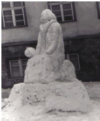
Fot. 9 Mikołaj Kopernik ze śniegu.

Dla uczczenia tego wydarzenia wykonana została również na lodowisku „Bajka” wielka rzeźba śniegowa z podobizną Mikołaja Kopernika.