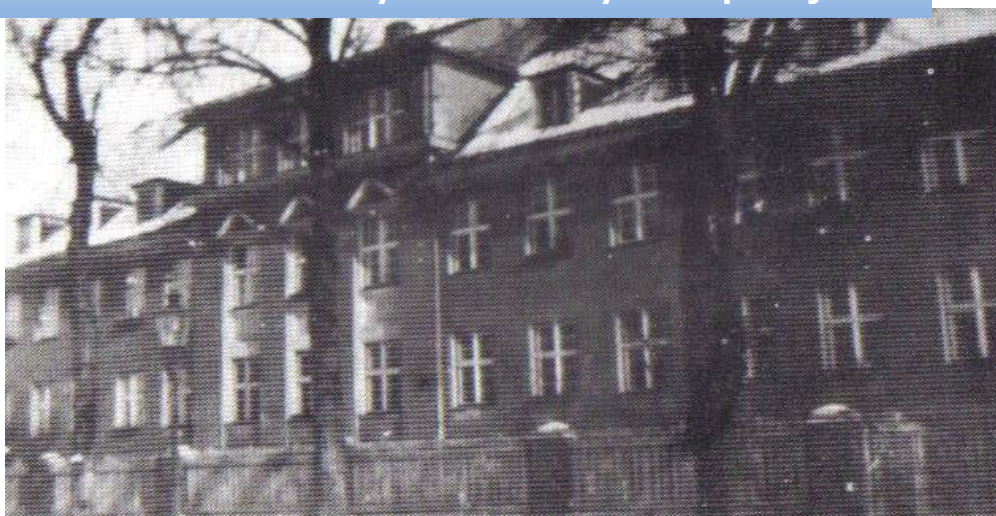
Fot 3. Szkoła Publiczna widok z dzisiejszej ulicy Słowiańskiej(ówczesna Grudziądzka)-fotografia powyżej.