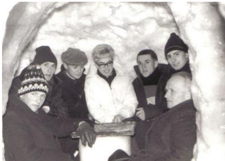
Fot. 14 Halina Pilejczyk w grocie śnieżnej na lodowisku.

była wicemistrzyni olimpijska Halina Pilejczyk, która gościła wraz z całą drużyną narodową w 1965 roku.