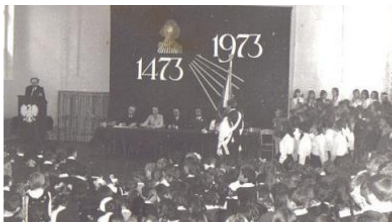
Fot.10 Uroczystości 500 urodzin Mikołaja Kopernika.

W dniu 3 marca 1973 roku odbyła się kolejna impreza związana z patronem. Były to uroczyste obchody 500 urodzin wielkiego astronoma.