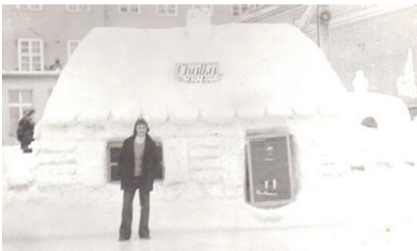
Fot. 12 Jedna z kawiarni na lodowisku - „Chatka Baby Jagi”.