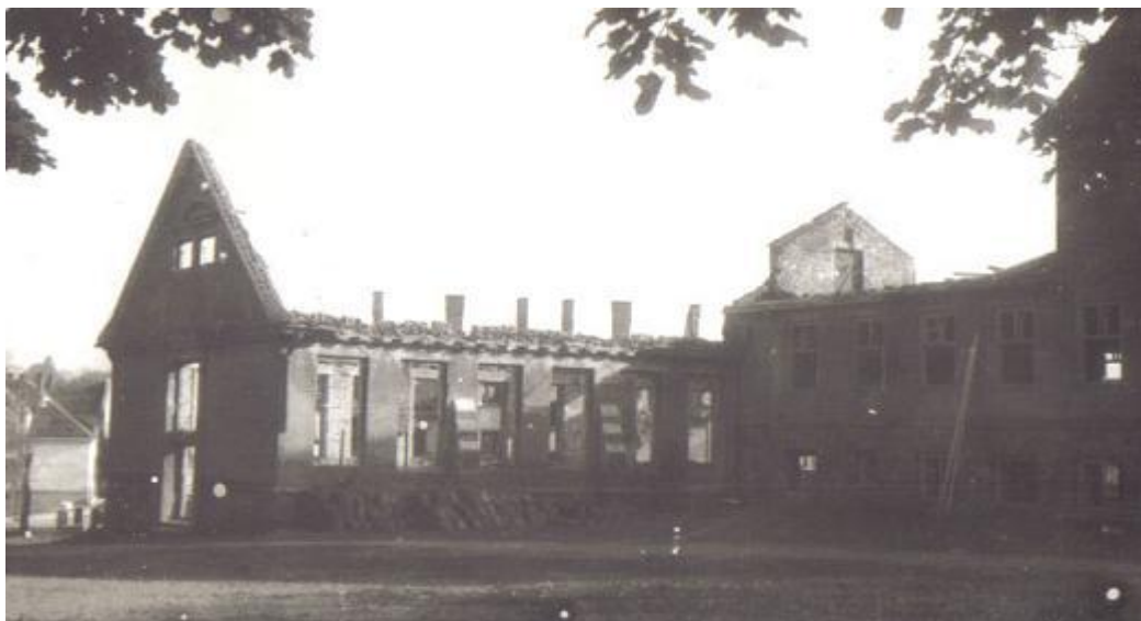
Fot 7. Widok na zniszczoną szkołę wraz z salą gimnastyczną -1945.