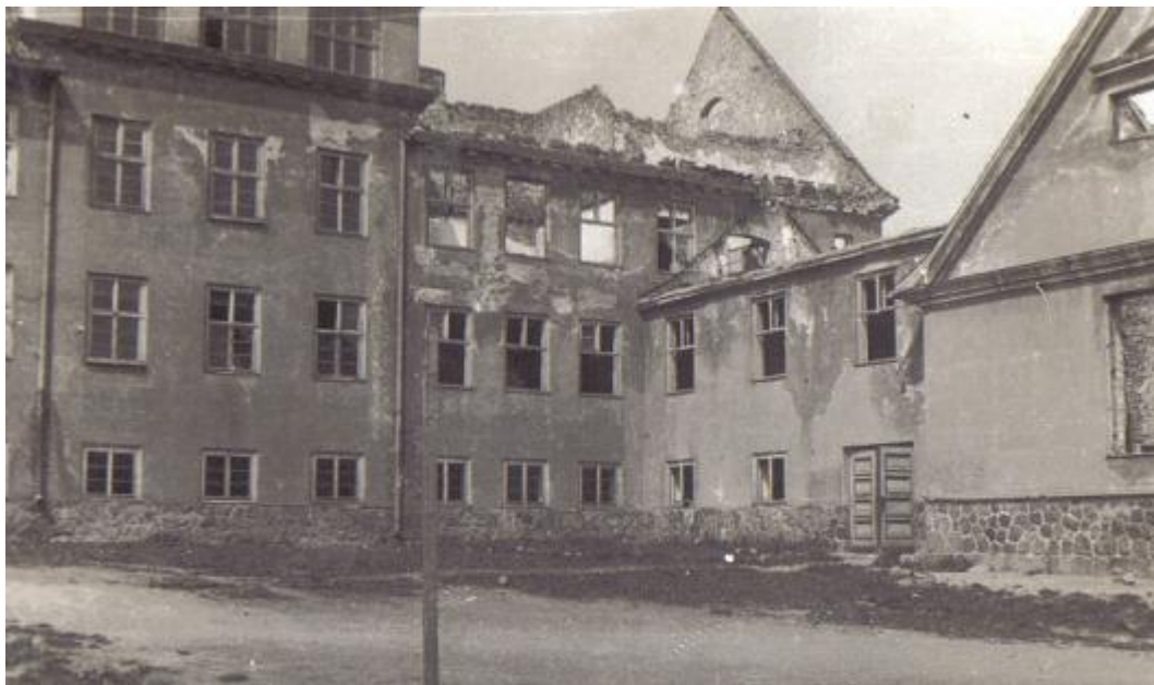
Fot 6. Wygląd szkoły rok 1945.

Wraz z wybuchem II wojny światowej w 1939 roku szkoła nadal funkcjonowała. Zmieniła się jedynie obsada okręgowego kuratorium w Olecku. Za Bajhora, który wstąpił do armii niemieckiej(Wermachtu)powołany został Waitschies. Sytuacja diametralnie zmieniła się, gdy wojska niemieckie wycofały się z frontu wschodniego i realnym stało się zagrożenie ze strony Armii Czerwonej. W tej sytuacji Szkoła Publiczna przed wakacjami 1944 roku zawiesiła swoją działalność. W pomieszczeniach szkolnych utworzony został szpital polowy. W Olecku po wakacjach 1944 kontynuowana była jedynie nauka w Domu Sierot, lecz i ten stał się wkrótce polowym szpitalem. W roku 1945 budynek szkolny przy dzisiejszej Słowiańskiej zostaje zniszczony. Zdjęcie poniżej