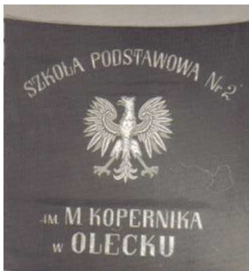
Fot. 8 Sztandar Szkoły Podstawowej nr 2 w Olecku.

W maju 1964 roku z inicjatywy Komitetu Rodzicielskiego rozpoczęto starania o ufundowanie szkole sztandaru i nadaniu jej patrona. Po wielu zbiórkach, a także wpłatach instytucji publicznych, sztandar został ufundowany. Nastąpiło to 23 stycznia 1965 i wiązało się również z obchodami dwudziestej rocznicy wkroczenia Armii Czerwonej do Olecka. Pamiątkowe zdjęcia pod sztandarem wbili przedstawiciele ówczesnych partii, instytucji i organizacji.