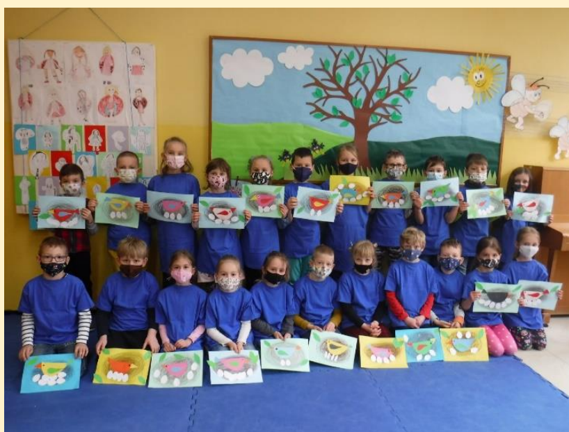
Deň Zeme v ŠKD