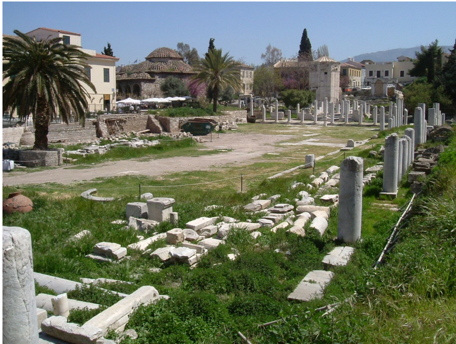
Agora w Atenach