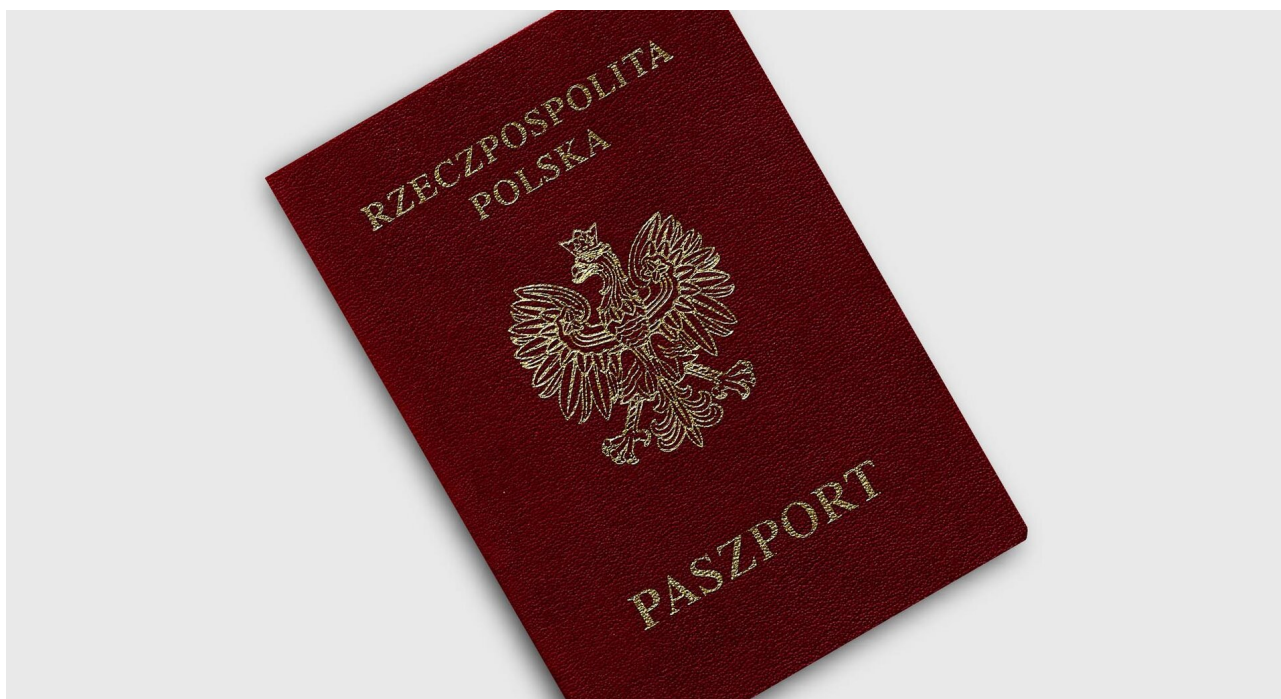
Okładka polskiego paszportu