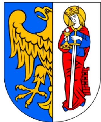
HERB RUDY ŚLĄSKIEJ