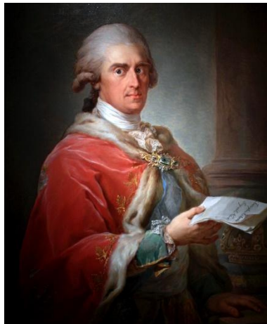
Fryderyk August, książę warszawski, obraz pędzla Marcella Bacciarellego z ok. 1808–1809 r.

Dwaj cesarze (francuski i rosyjski) spotkali się 25 czerwca 1807 r. na tratwie na rzece Niemen w Tylży. Ostatecznie 7 lipca podpisany został traktat pokojowy francusko-rosyjski, a 9 lipca francusko-pruski. Na mocy pokoju tylżyckiego (traktatu francusko-rosyjskiego i francusko-pruskiego) Prusy utraciły znaczne terytoria. Z ziem drugiego i trzeciego zaboru pruskiego utworzone zostało w lipcu 1807 r. Księstwo Warszawskie. Duży problem dla uczestników obrad stanowiło ustalenie, kto ma być jego władcą. Ostatecznie strony doszły do porozumienia i postanowiono, że będzie to król saski Fryderyk August. Tej decyzji przychylni byli także Polacy, ponieważ już w myśl Konstytucji 3 maja tron po Stanisławie Augustie Poniatowskim miał objąć Fryderyk August. Jednocześnie wybór ten uzależnił