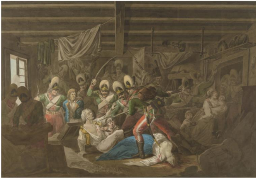
Aleksander Orłowski, Wzięcie Pragi , około 1800 r. Tematem akwareli jest epizod z powstania kościuszkowskiego, gdy podczas walk w Warszawie rosyjskie wojska pod dowództwem Aleksandra Suworowa zdobyły Pragę i 4 listopada 1799 roku dokonały tam rzezi ludności cywilnej. Obraz przedstawia carskich żołnierzy atakujących mieszkańców Pragi. Utrzymany jest w stonowanej kolorystyce ograniczającej się do brązów, przełamanych bielą, czerwienią i błękitem w centralnym miejscu kompozycji.