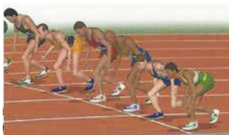
Rysunek 1 Start wysoki

W lekkoatletycznych konkurencjach biegowych obowiązują dwa rodzaje startów: niski i wysoki, które stosowane są w zależności od długości dystansu. W biegach krótkich (indywidualnych i sztafetowych do 400 m włącznie), wykorzystywany jest start niski. W biegach średnich i długich (od 800 m i dłuższych), zawodnicy rozpoczynają rywalizację ze startu wysokiego.